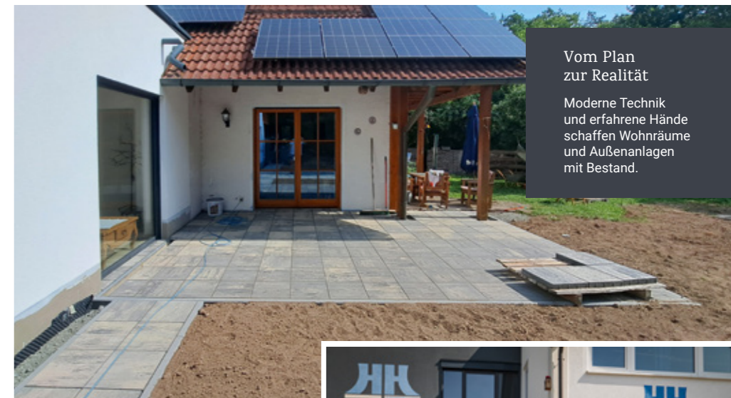
Vom Plan zur Realität

Moderne Technik und erfahrene Hände schaffen Wohnräume und Außenanlagen mit Bestand.