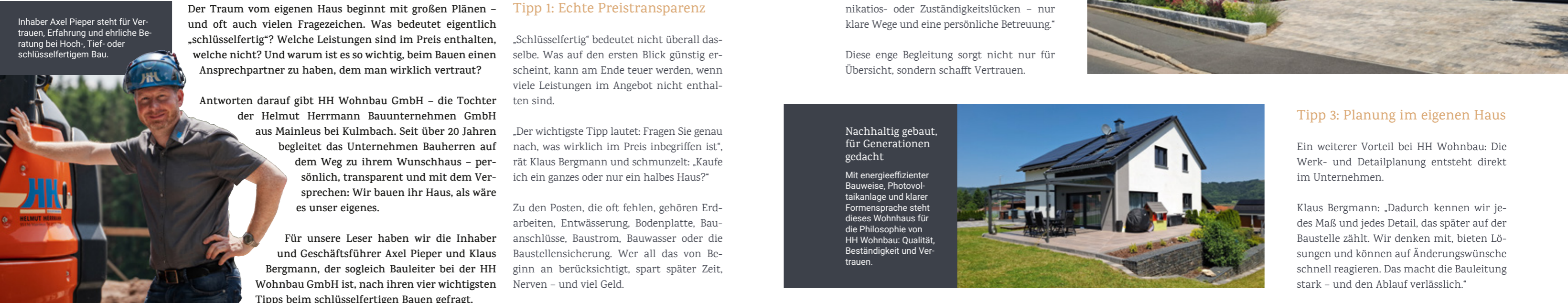
Inhaber Axel Pieper steht für Vertrauen, Erfahrung und ehrliche Beratung bei Hoch-, Tief- oder schlüsselfertigem Bau.