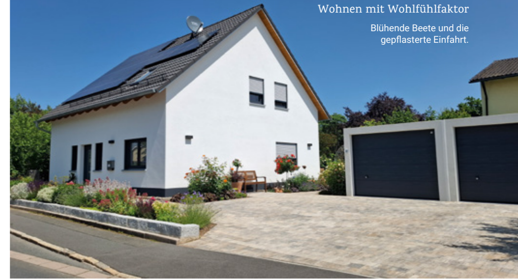
Wohnen mit Wohlfühlfaktor Blühende Beete und die gepflasterte Einfahrt.

Diese enge Begleitung sorgt nicht nur für Übersicht, sondern schafft Vertrauen.